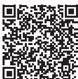
Scheda tecnica e ricambi